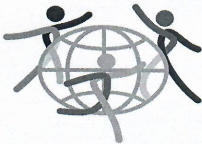
Игры иностранных студентов Северной столицы